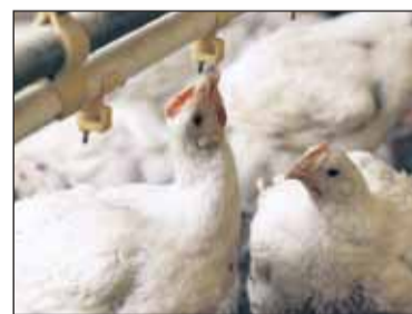
Het netwerk leverde volgens het OM aan vleeskuikenhouders.

Volgens Boone is sprake van een vlucht naar voren van justitie. Hij wijst erop dat de officier van justitie, Steven Pieters, die deze strafzaak leidt, is betrapt op ongeoorloofde beïnvloeding van