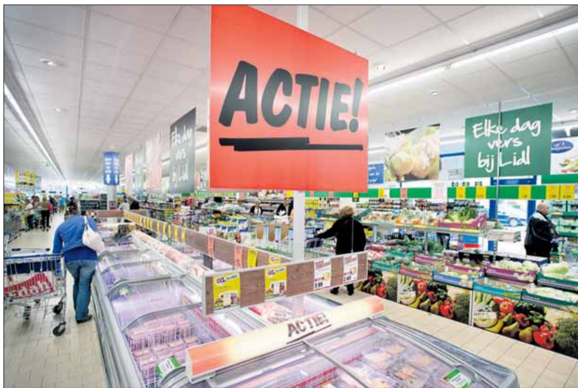
Door voortdurende prijsdruk in supermarkten blijft er minder geld over voor vernieuwing.

ook kunnen leveren aan buitenlandse ketens. Dat geldt echter niet voor de kleine en middelgrote leveranciers, voor wie het wegvallen van een afnemer direct 30 procent van de omzet kan schelen."