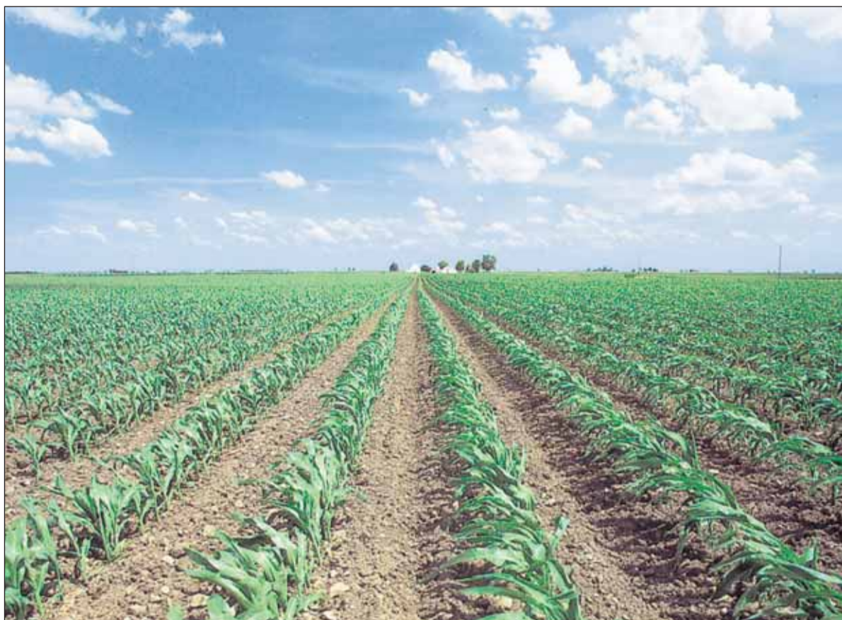
Illinois behoort tot de cornbelt, de grootste opbrengstregio voor mais ter wereld.